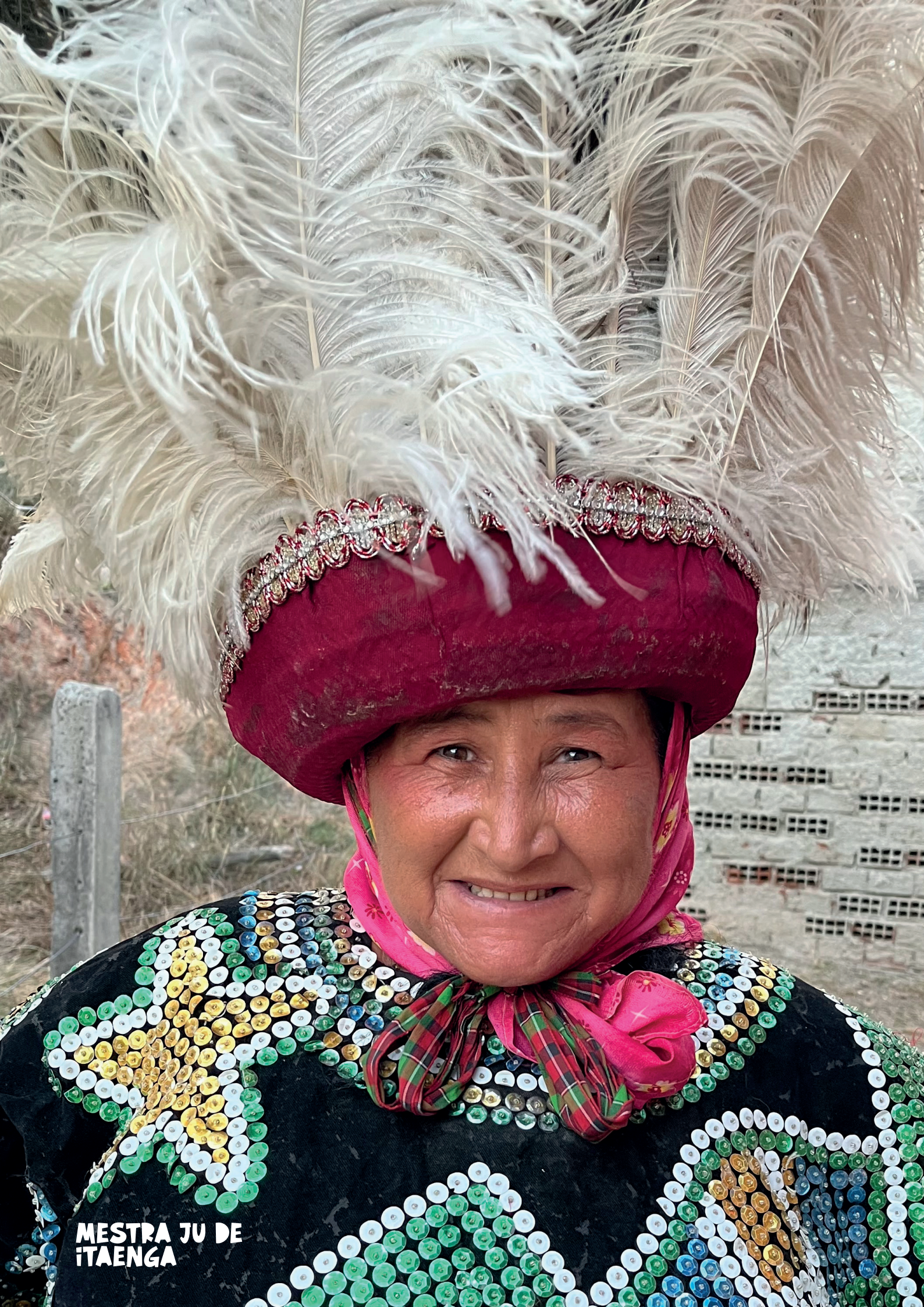
MESTRA JU DE ITAENGA